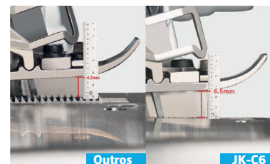
Altura do calcador com maior espaço de trabalho